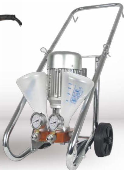
Electric Motor Version

M2 è una pompa leggera e maneggevole progettata per le iniezione di prodotti bicomponenti. Funziona per mezzo di un trapano o su richiesta, di un motore elettrico. MASTER Spraying Technology ha scelto la qualità HILTI per la sicurezza e affidabilità dei suoi prodotti.